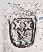
Stadskeur Avondmaalsschotel 1704/05 - 1728/29

Afgeschuinde schildvorm Gebruiktussen 1701 - 1729