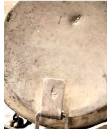
Halssieraad. A.Damen, Bergen op Zoom, ca 1850; D = 3,8 cm; G = 44 gram