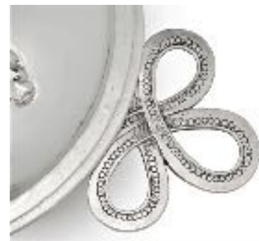
Details van de terrine, Bergen op Zoom, 1689/81, Willem Brouwers