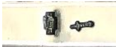
Een zoutlepelkje, keurig gekeurd. Het 835 zwaardje en •Anx in veelhoek, Andriessen, Bergen op Zoom, het keur gebruikt van 1946-1964.