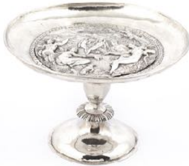
De tazza, zoals die werd aangeboden bij het veilinghuis.