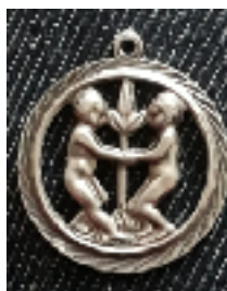
Het hangertje met sterrenbeeld tweelingen

Onze Facebookpagina heeft z'n nut. Een mevrouw uit Apeldoorn stuurde onderstaande foto van een klein, 21 mm, zilveren hangertje met het V3G meesterkeur, gebruikt van 1977 – 2002, van de gebroeders van Giels.