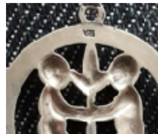
het meesterteken van van Giels

Ik vroeg me eerst af wat de afbeelding voorstelde, die twee blote mannetjes rond een boompje, het bleek te gaan om het sterrenbeeld Tweeling. Van een van de laatste directeuren bij van Giels hoorde ik dat de complete serie zilveren sterrenbeeld hangertjes, 12 op een plaat, destijds bij tienduizenden verkocht is en de hele wereld over ging.