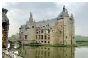
Het imposante Slot van Laarne