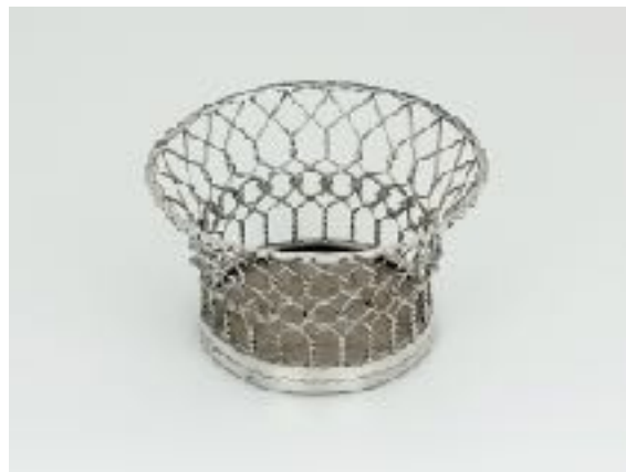
en hier wat groter....