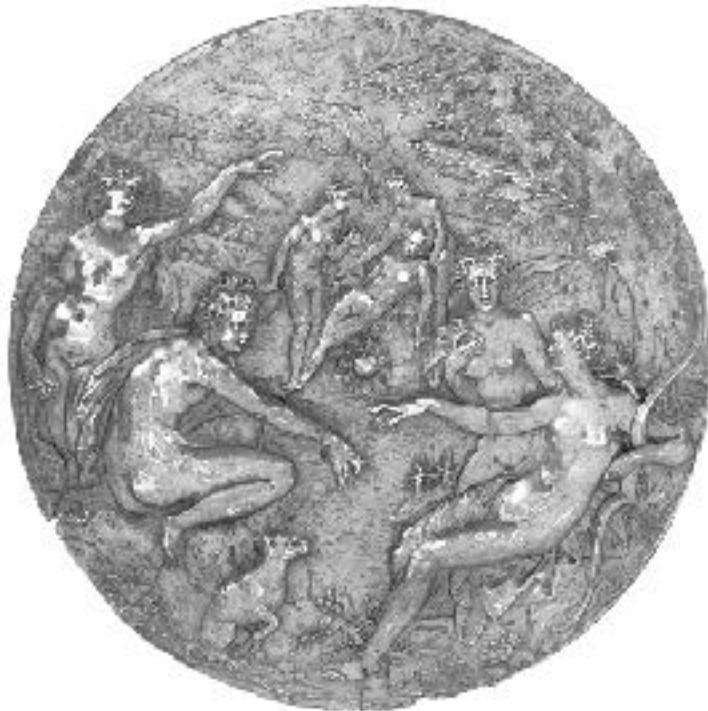
De plaquette, verkocht bij een veilinghuis in Londen.