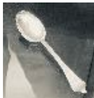
De lepel, foto uit de folder