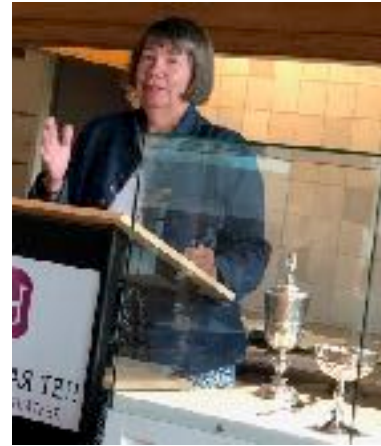
De beker, Bergen op Zoom 1595, Jan II de Clerck