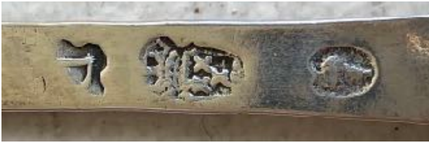
De keuren op de lepel, foto's van 5/7/19