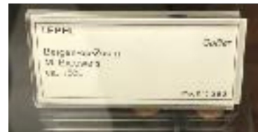
De tekst bij de lepel, in de vitrine