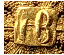
De kleine gouden broche van J.C. van Baal en het meesterteken I B.