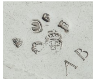
Bekertje, Bergen op Zoom, 1678/9, Philippus van der Heijs