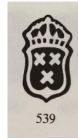
De valse beker, met de keuren in de bodem. Rechts het valse stadskeur uit de "rode Citroen"

Aan deze verkoop was het nodige voorafgegaan.