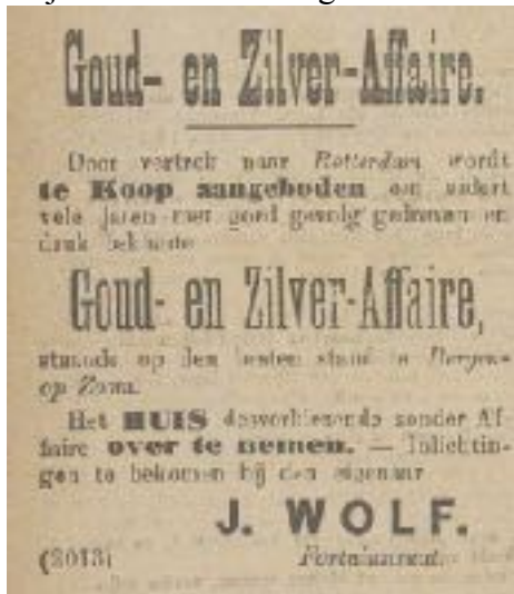
De Grondwet van 23 december 1880.