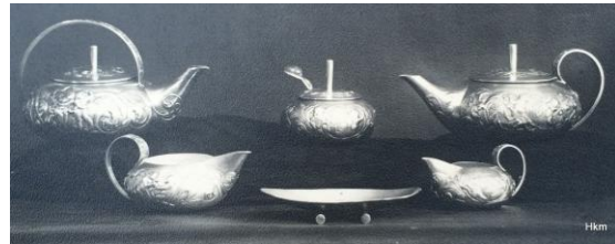
Eerste gehalte theeservies, Wim Pelle, Bergen op Zoom